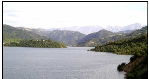
Barrage de Taksebt

Une convention a été signée entre, l'ENST (Ecole Nationale Supérieure du Tourisme algérien), l'UNAT (Union Nationale des Associations de Tourisme française) et Touiza Solidarité pour l'accueil d'étudiants de l'ENST en stage d'été dans une structure française. 17 étudiants algériens sont arrivés en région PACA en juillet et ont suivi un stage pratique de management d'institutions touristiques jusqu'à la fin du mois d'août.