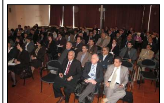
Conférence sur le Tourisme responsable et solidaire, ENST, Alger, février 2009.