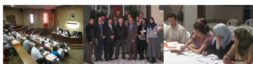
Stages d'Alger, Rabat et ateliers de formations

Le rapport intermédiaire d'évaluation-capitalisation sera validé par le Comité de Pilotage en septembre. Le rapport final sera présenté à toutes les parties prenantes de cette évaluation-capitalisation lors d'un séminaire final de restitution , qui se tiendra en décembre prochain.