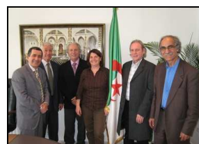
Délégation du PRIDES Carac'terres au Ministère de l'Aménagement du territoire, de l'Environnement et du Tourisme algérien