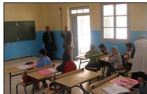
Ecole communale de Ain Turk